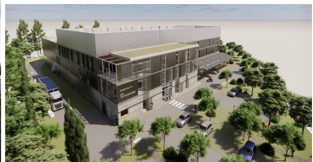
Vue du projet depuis le chemin de Capeau –