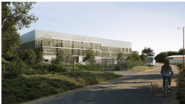
Vue axonométrique – AT&E Architectes

Environ 40 personnes y travailleront, dont 20 agents de tri. La moitié sera issue de l'insertion.